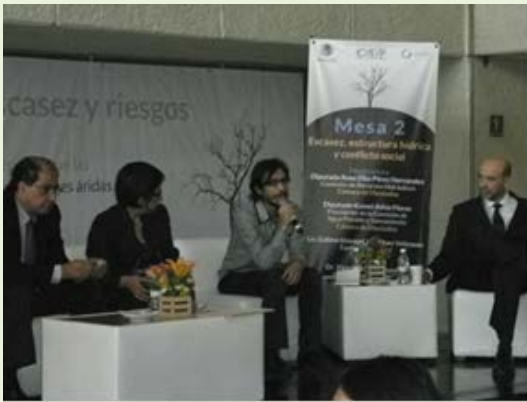
MESA DOS: Escasez