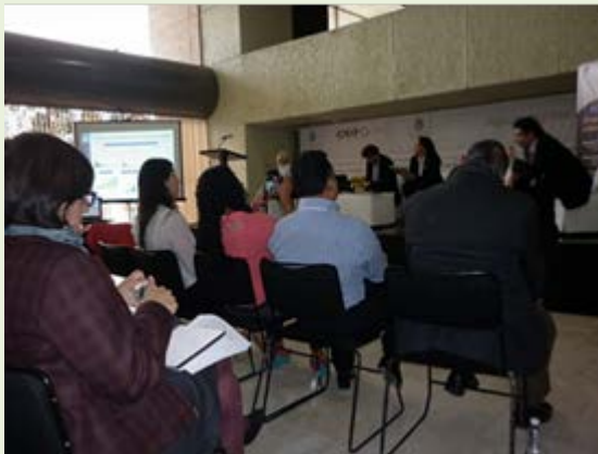
Una de las tres mesas del evento