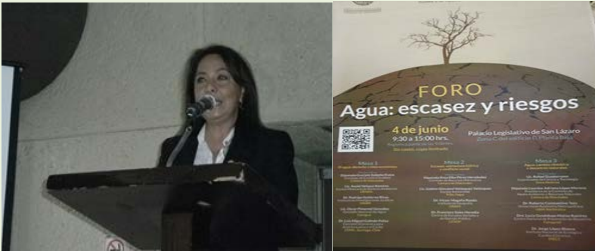
Diputada Graciela Saldaña Fraire, integrante de la Comisión de Cambio Climático.

En este Foro organizado el 4 de junio en la Cámara de Diputados, por la Comisión de Cambio Climático y el Centro de Estudios Sociales y de Opinión Pública (CESOP), se analizó la escasez del agua, que tan solo para 2030 se necesitará 30 por ciento más de este líquido para satisfacer el consumo.